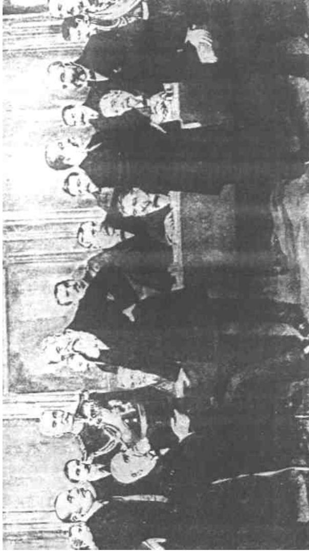
Delegații statelor balcanice la Conferința de pace, de la București (1913)